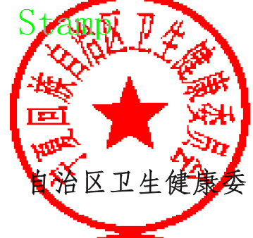
自治区卫生健康委