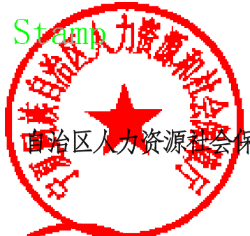
自治区人力资源和社会保障厅