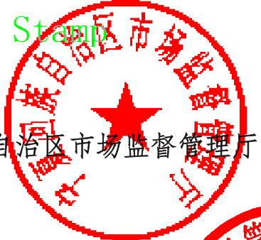
自治区市场监督管理局