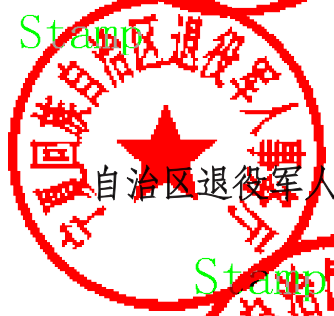
自治区退役军人事务厅