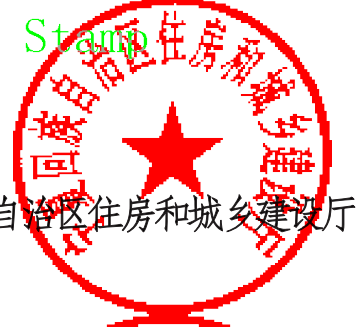
自治区住房和城乡建设厅