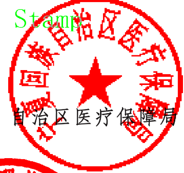
自治区医疗保障局